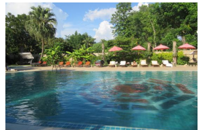
Tao Garden : nature, architecture et art