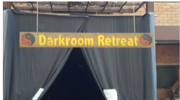
l'entrée de la chambre noire